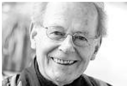
Von Niklaus Brantschen