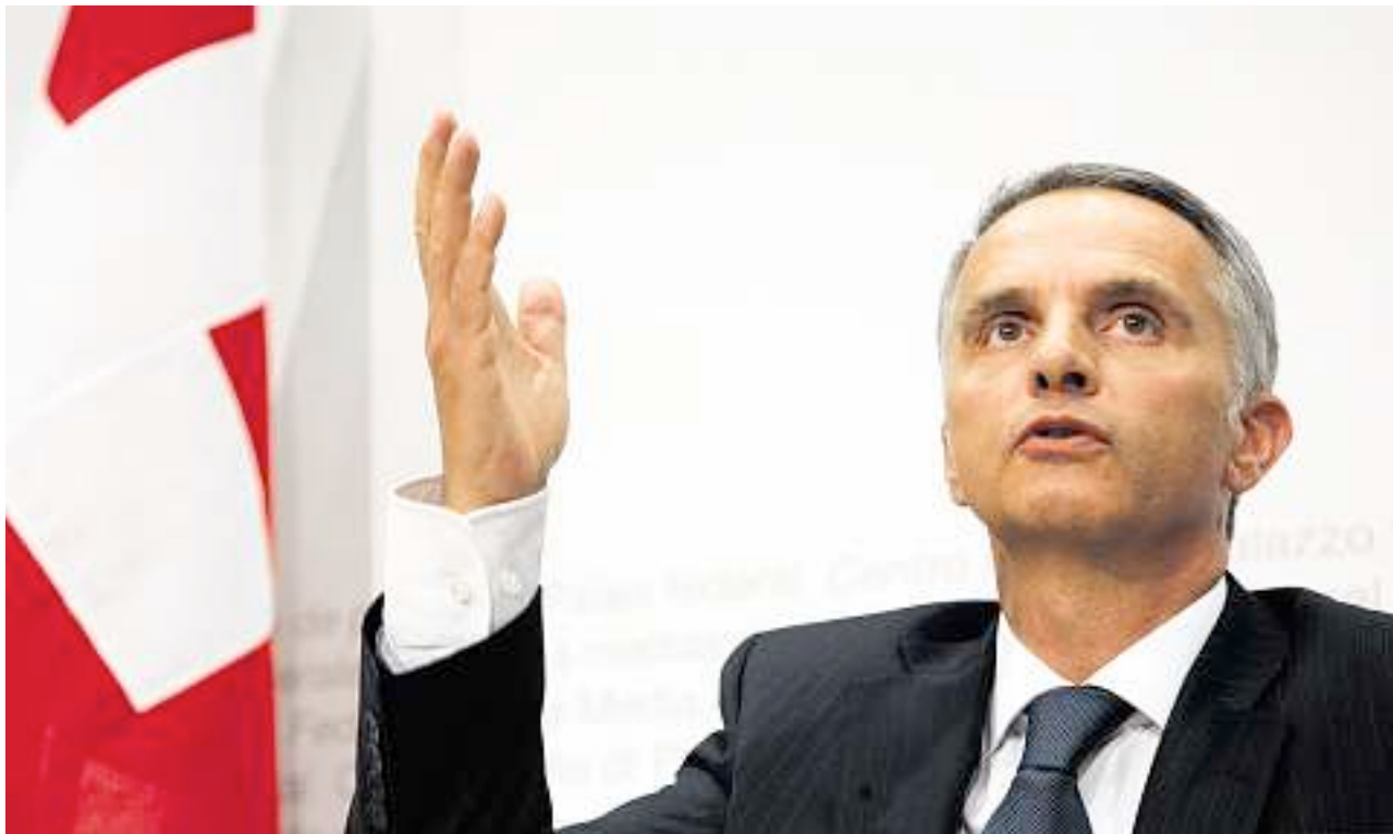
«Erfolge sind nur dann zu realisieren, wenn alle bereit sind, nur 80 Prozent zu erhalten»: Bundesrat Didier Burkhalter fordert mehr Kompromissbereitschaft in der Politik.

Wir spielten in Israel in Städten wie Jerusalem oder Tel Aviv. Es war aber auch Tradition, dass wenn immer ein internationales Team im Land war, man im Süden in der Stadt Beersheba gegen eine Beduinen-Mannschaft antrat. Wir hatten das Angebot sehr gerne angenommen, gespielt und gewonnen. Dann war es von einem Augenblick auf den anderen unter den Zuschauern mucksmäuschenstill. Kein Applaus, keine Gesänge, nichts