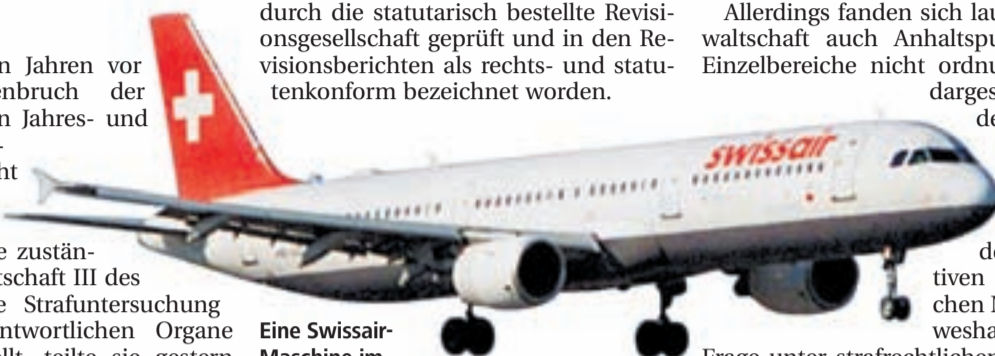
Eine Swissair-Maschine im Frühling 2000.

Die zuständige Staatsanwaltschaft hat deshalb in einem gesonderten Strafverfahren die in den Jahres- und Konzernrechnungen 1998, 1999 und 2000 wiedergegebenen Finanzangaben untersucht. Die Rechnungen waren durch die statutarisch bestellte Revisionsgesellschaft geprüft und in den Revisionsberichten als rechts- und statutenkonform bezeichnet worden.