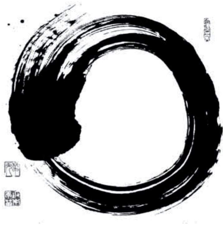
Kalligraphie von Sanae Sakamoto, © by Sanae Sakamoto