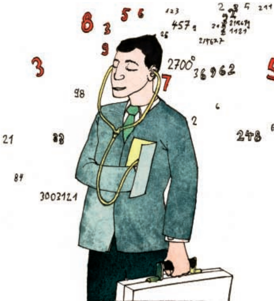
Integrale Führung bedeutet ganzheitliche Transformation.