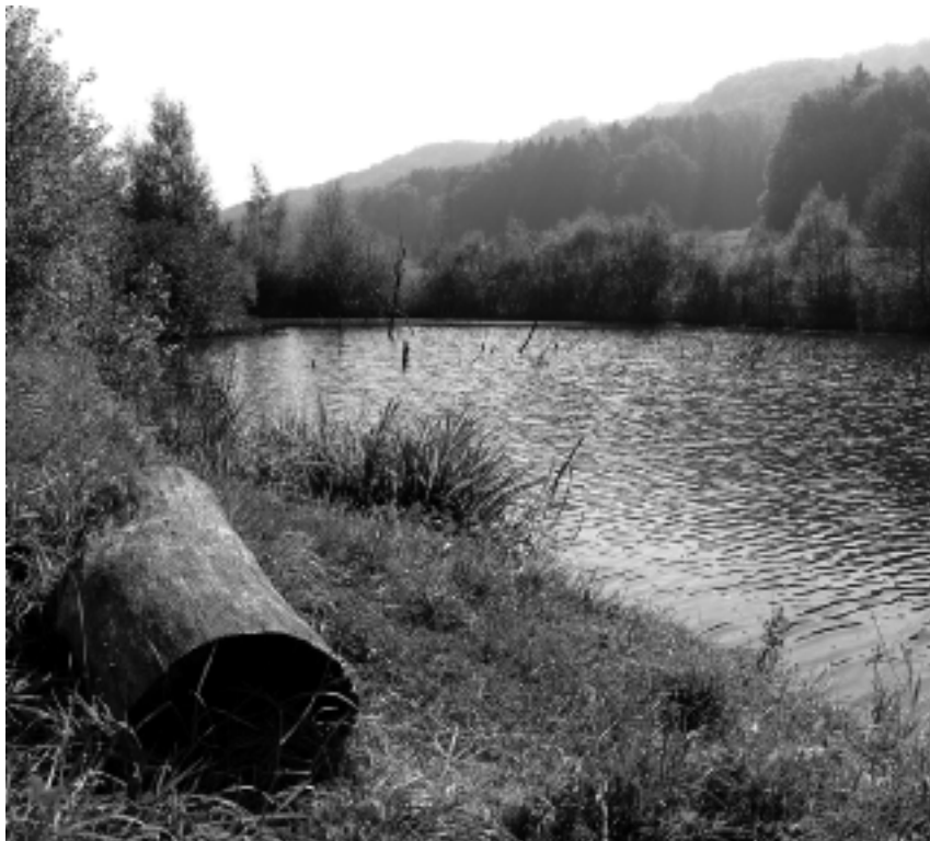
Ab 2007 wird der «Dättnauer-Weiher» oberirdisch abfliessen.

Für den Bachausbau werden spezielle Transportpisten angelegt, damit der Grossteil der Transporte auf diesen Wegen abgewickelt werden kann und das öffentliche Strassennetz nur minimal durch den Baustellenverkehr betroffen ist. An zwei Infokästen (beim Ziegeleiareal und beim Brüttemerfussweg) wird über das Projekt, die aktuellen Bauphasen und die Ansprechpersonen informiert.